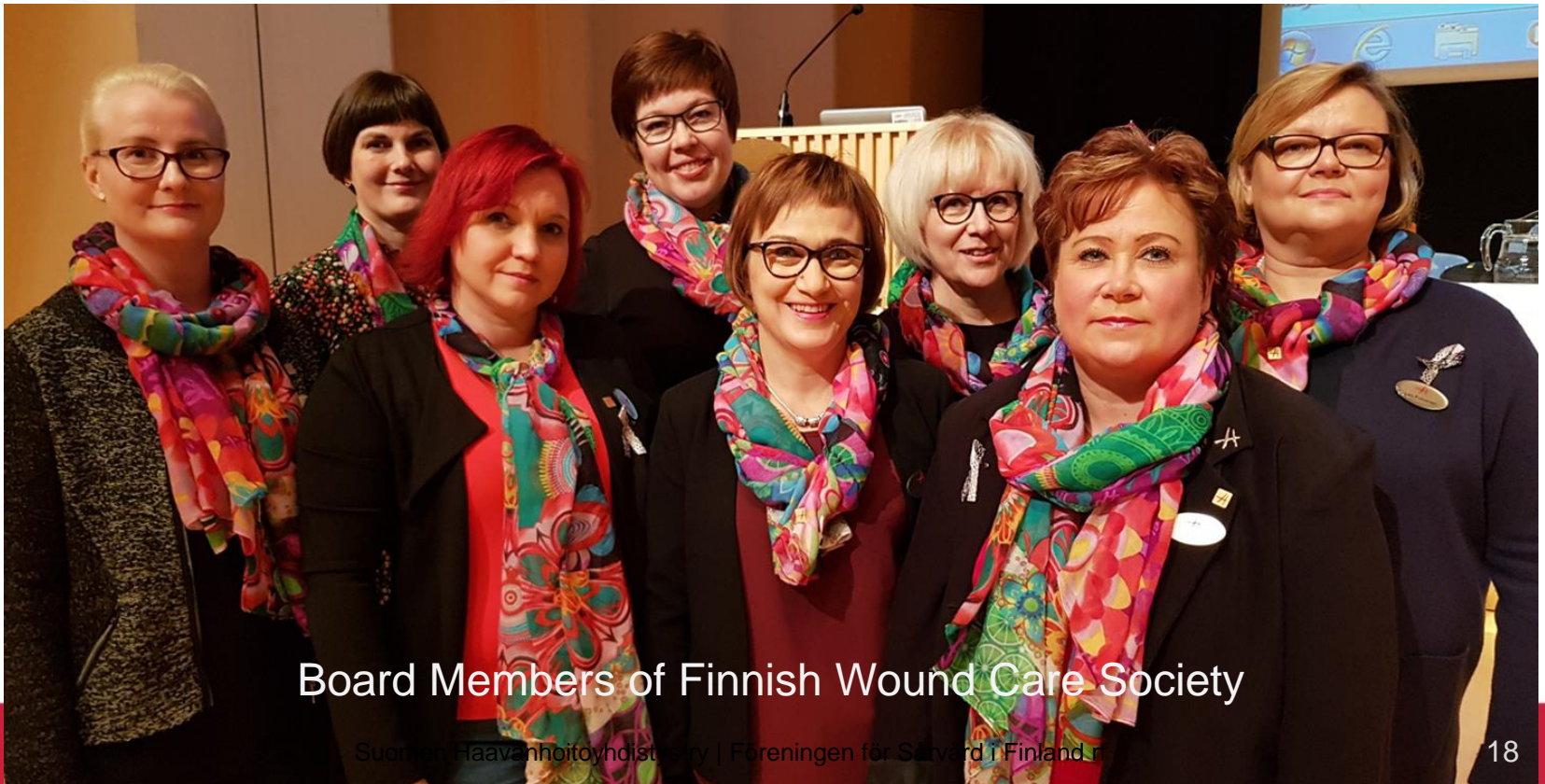
Board Members of Finnish Wound Care Society

Thanks to everyone who has promoted the STOP PU Day and is working hard preventing pressure ulcers in Finland!